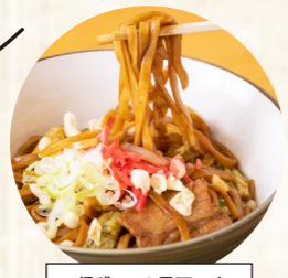
B級グルメの黒石つゆ やきそばは絶品です!