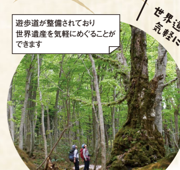
遊歩道が整備されており世界遺産を気軽にめぐることができます