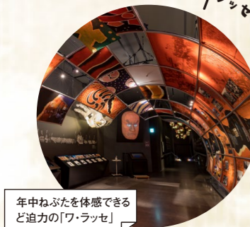
年中ねぶたを体感できる 迫力の「ワ・ラッセ」