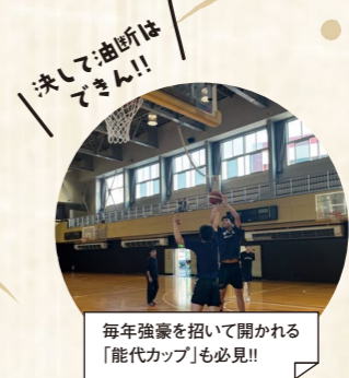
毎年強豪を招いて開かれる「能代カップ」も必見!!